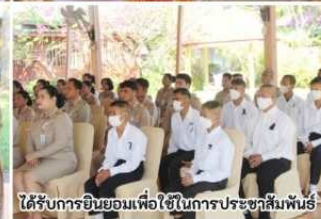
ได้รับการยินยอมเพื่อใช้ในการประชาสัมพันธ์

วันพฤหัสบดีที่ 8 มกราคม 2569 เวลา 09.00 น.