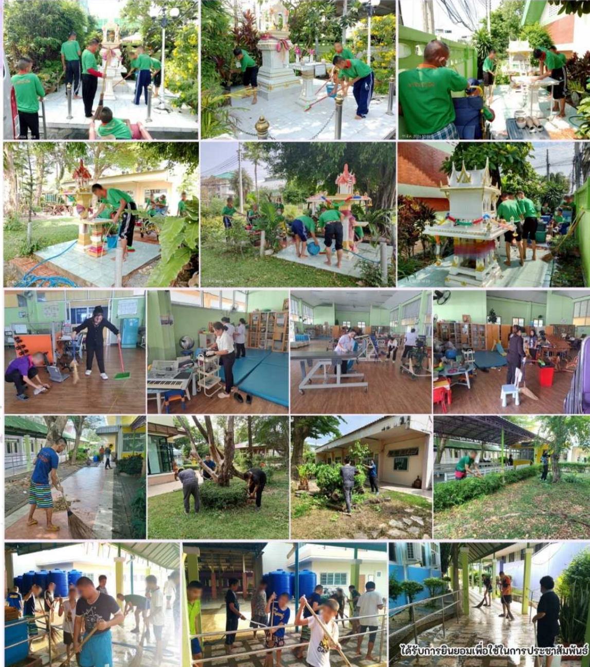
ได้รับการยินยอมเพื่อใช้ในการประชาสัมพันธ์

กิจกรรม Big Cleaning Day ทำความสะอาดบริเวณโดยรอบหน่วยงาน