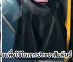
ได้รับการยินยอมเพื่อใช้ในการประชาสัมพันธ์

วันอาทิตย์ที่ 23 พฤศจิกายน 2568 เวลา 12.00 น.