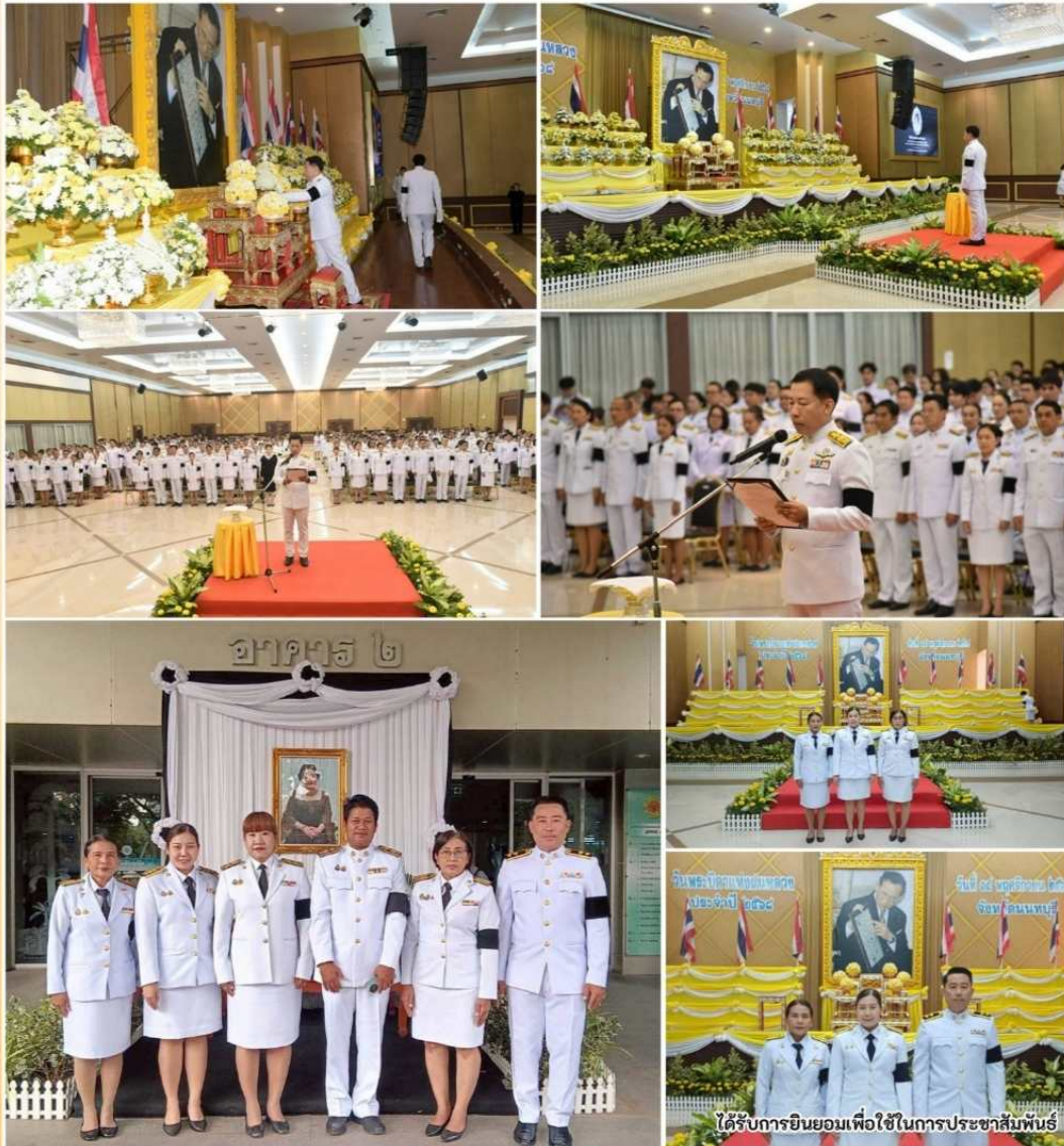
ได้รับการยินยอมเพื่อใช้ในการประชาสัมพันธ์

วันศุกร์ที่ 14 พฤศจิกายน 2568 เวลา 09.00 น.